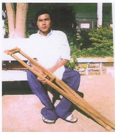
Nam en 2006