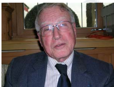
« FAMILLE DU ROTARY. »