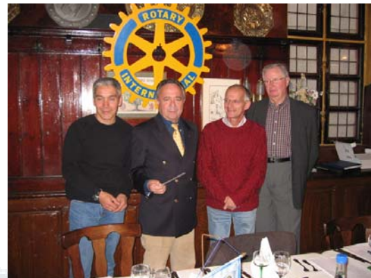
Photo RC Sélestat Centre Alsace

A noter que notre Club finance la scolarité de 3 enfants au Vietnam, et participe avec le Rotary Club de Sélestat en partenariat avec le RC de Antsirabe à Madagascar à l'octroi de bourses à 21 étudiants nécessiteux dans une université de cette ville.