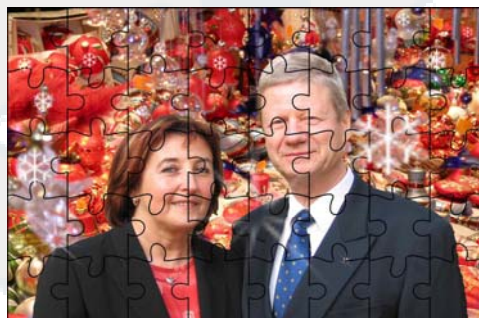
Le puzzle est offert pour Noël

Y' aura de la joie si nous parvenons à réaliser et réussir ce que nous entreprenons.