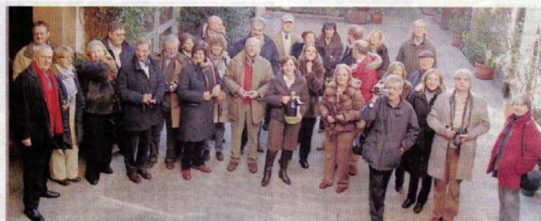
Une délégation de rotariens génois était récemment en visite dans notre région. (-)

Le Rotary-club du Kronthal termine cette année 2006 avec de nombreux projets d'aide aux plus démunis, qu'ils soient à proximité ou à l'autre bout du monde.