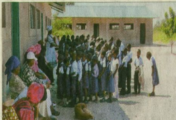
Diszipliniert in Reihen aufgestellt warten die Mädchen und Buben der Ambrosius-Schule in Okahao, bis die neuen Klassenzimmer betreten dürfen.

„Das ist klassische Hilfe zur Selbsthilfe“, erklärt der Jurist. Denn die Schule entstand 2002 aus Eigeninitiative afrikanischer Eltern, die „damals beschlossen hatten, dass sie selbst etwas für die Bildung und die Zukunft ihrer Kinder tun wollen.“ Darum zahlen sie auch das mo-