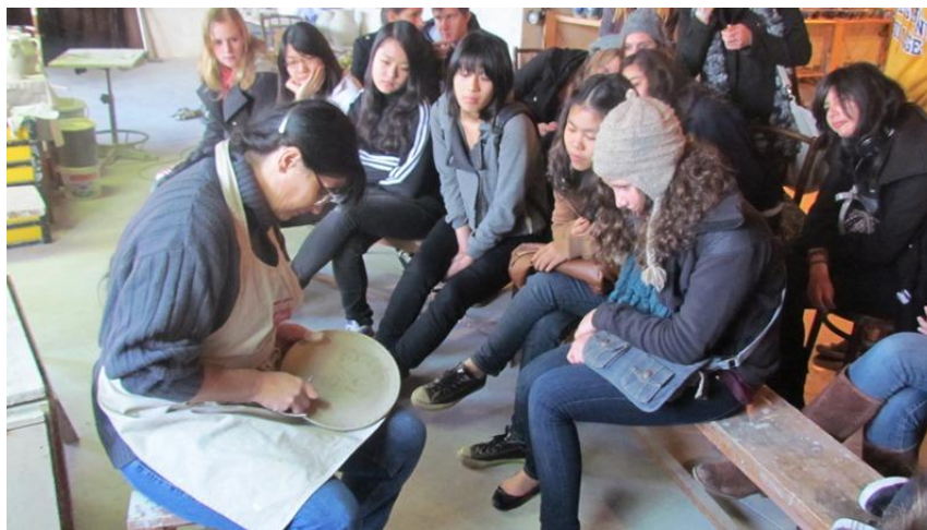
Gravure à la main

Puis direction le Fort de Schönenberg, visite guidée.