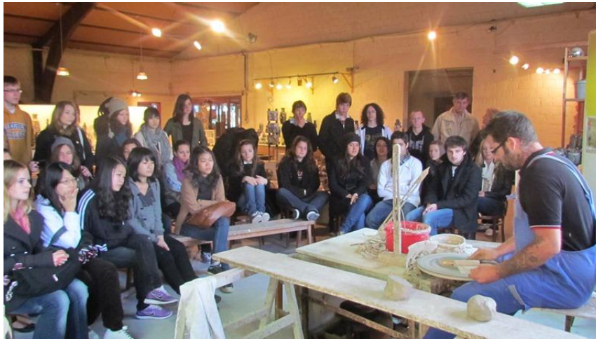
Une pièce tournée

Le lendemain direction Betschdorf, poterie Remmy, pour une visite et démonstration de la chaîne de fabrication artisanale avec leur fameuse terre bleutée