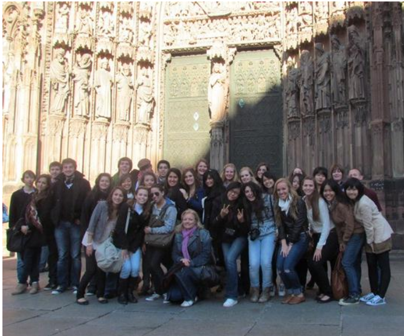
Visite traditionnelle et incontournable de la Cathédrale de Strasbourg

Tout se passe très bien avec en prime le beau temps !!!