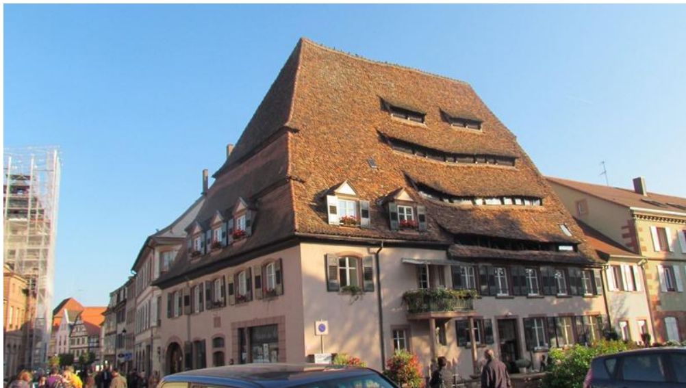
La maison du sel avec son toit déformé

Le temps passe très vite la journée se termine par une petite visite commentée de Wissembourg