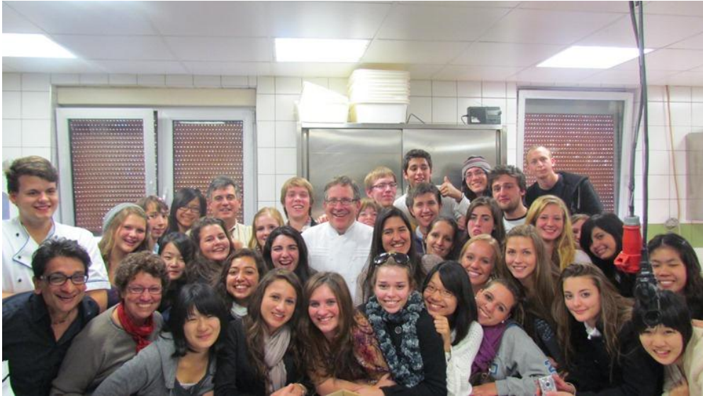
Photo souvenir de la bonne humeur avec Le Maître Chocolatier

Le temps passe très vite la journée se termine par une petite visite commentée de Wissembourg